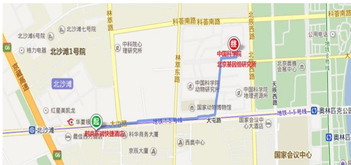
时尚东润快捷酒店位置图

公交站： 北沙滩桥东，途经 425 路；484 路；518 路；594 路；607 路；617 路；695 路；751 路；特 13 路；特 15 路；夜 14 路；运通 110 线。