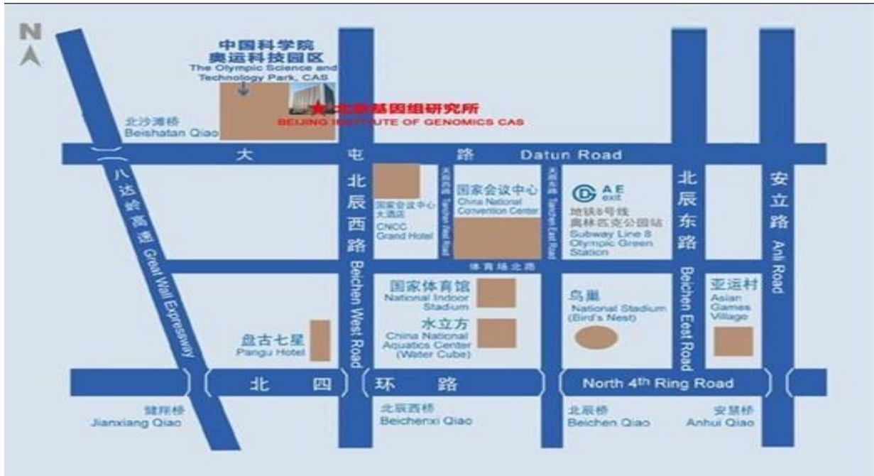
附件 4: 北京基因组研究所位置图