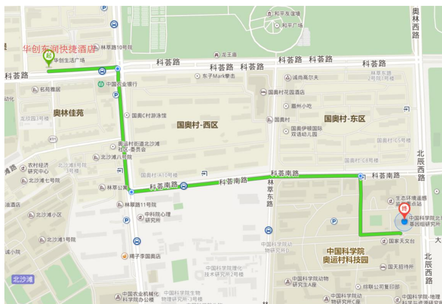
华创东润快捷酒店位置图

华创东润快捷酒店：北京市朝阳区林萃路 16 号。电话：010-57761958。公交站：林萃路口西，途经 466 路，专 44 路；林萃路口北，途经 81 路；379 路；510 路；专 44 路。